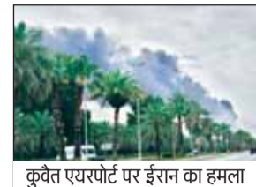
कुवैत एयरपोर्ट पर ईरान का हमला