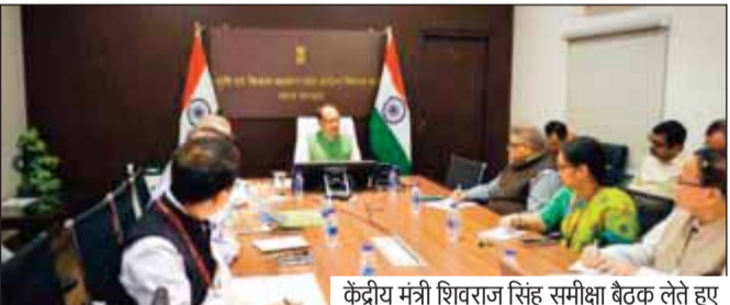
केंद्रीय मंत्री शिवराज सिंह समीक्षा बैठक लेते हुए

केंद्रीय कृषि मंत्री शिवराज सिंह चौहान ने बुधवार को एक समीक्षा बैठक बुलाई, जिसमें पश्चिम एशिया में जारी संकट के बीच खाद की आपूर्ति मजबूत करने, कालाबाजारी रोकने और अन्य जरूरी कदमों पर जोर दिया गया। कृषि एवं किसान कल्याण मंत्रालय ने एक आधिकारिक बयान में कहा कि बैठक में आने वाले खरीफ सीजन को ध्यान में रखते हुए तैयारियों की भी समीक्षा की गई। कृषि मंत्रालय ने बताया कि लक्ष्य यह है कि किसानों को समय पर खाद, बीज और अन्य जरूरी संसाधन मिल सकें।