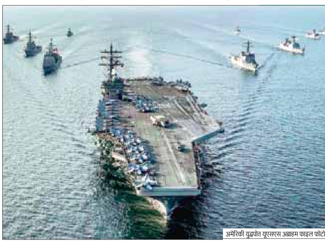
अमेरिकी युद्धपोत यूएसएस अब्राहम फाइल फोटो

►► ईरान बोला- युद्धपोत की हर गतिविधि पर पैनी नजर ►► कोई भी शत्रुतापूर्ण गतिविधि बर्दाश्त नहीं की जाएगी ►► ईरान अपनी भूमि और समुद्री क्षेत्र की रक्षा के लिए तैयार