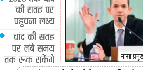
नासा प्रमुख जेरेड इसाकमैन