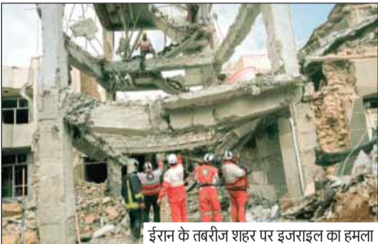
ईरान के तबरीज शहर पर इजराइल का हमला

दक्षिणी लेबनान में इजराइल के हमले में नौ लोगों की मौत का दावा किया जा रहा है। लेबनान के स्वास्थ्य मंत्रालय ने बताया कि फिलिस्तीनी शरणार्थी कैंप पर हुए हमले में छह लोगों की मौत हुई और एक अन्य जगह पर हुए हमले में तीन अन्य की मौत हुई है। इजराइली सेना ने लेबनान की राजधानी बेरूत के दक्षिणी इलाकों में बमबारी की है। लेबनान के स्वास्थ्य मंत्रालय ने बताया कि बीती 2 मार्च से इजराइली हमलों में लेबनान में 1072 लोग मारे गए हैं।